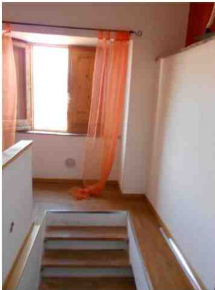
Foto N. 31.- livello sottotetto, disimpegno