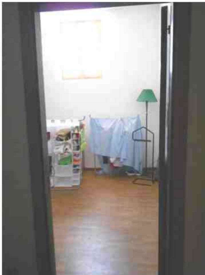
Foto N. 9.- Piano Terra/rialzato - camera 2