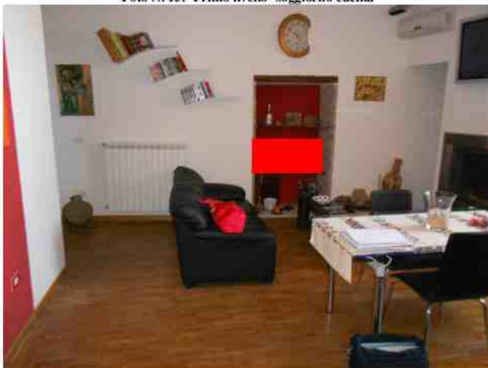
Foto N. 16.- Primo livello- soggiorno cucina