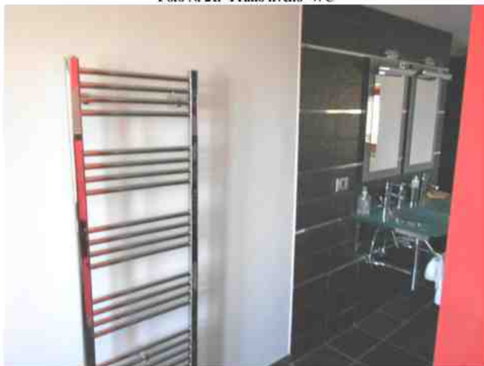
Foto N. 22.- Primo livello- WC