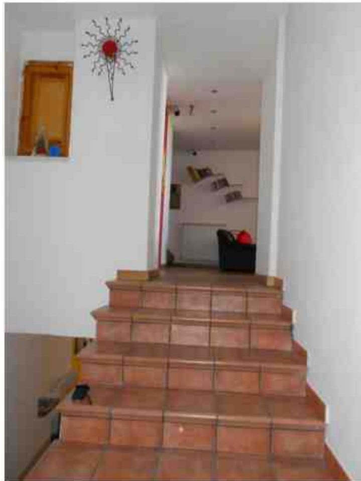
Foto N. 12.- Prosecuzione scala interna al primo livello