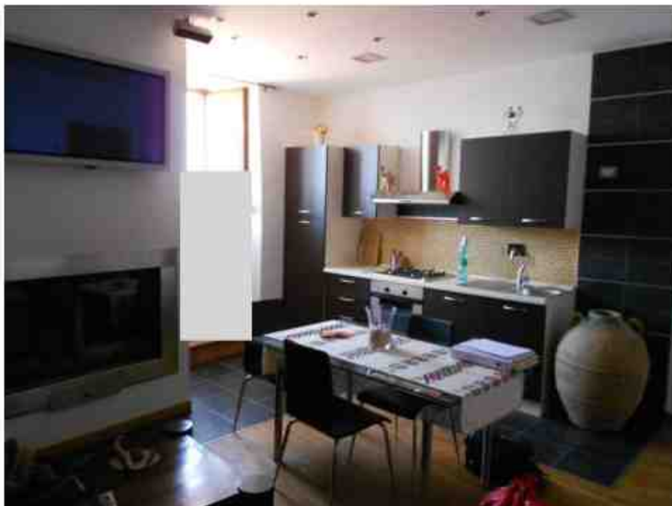
Foto N. 15.- Primo livello- soggiorno cucina