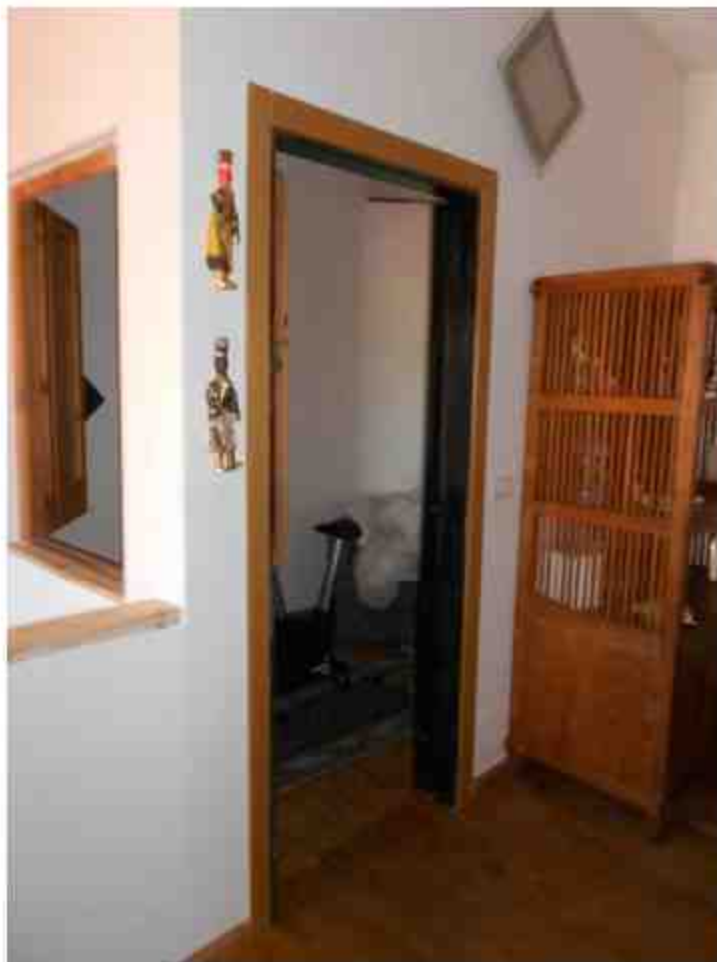
Foto N. 35.- livello sottotetto, vano laterale