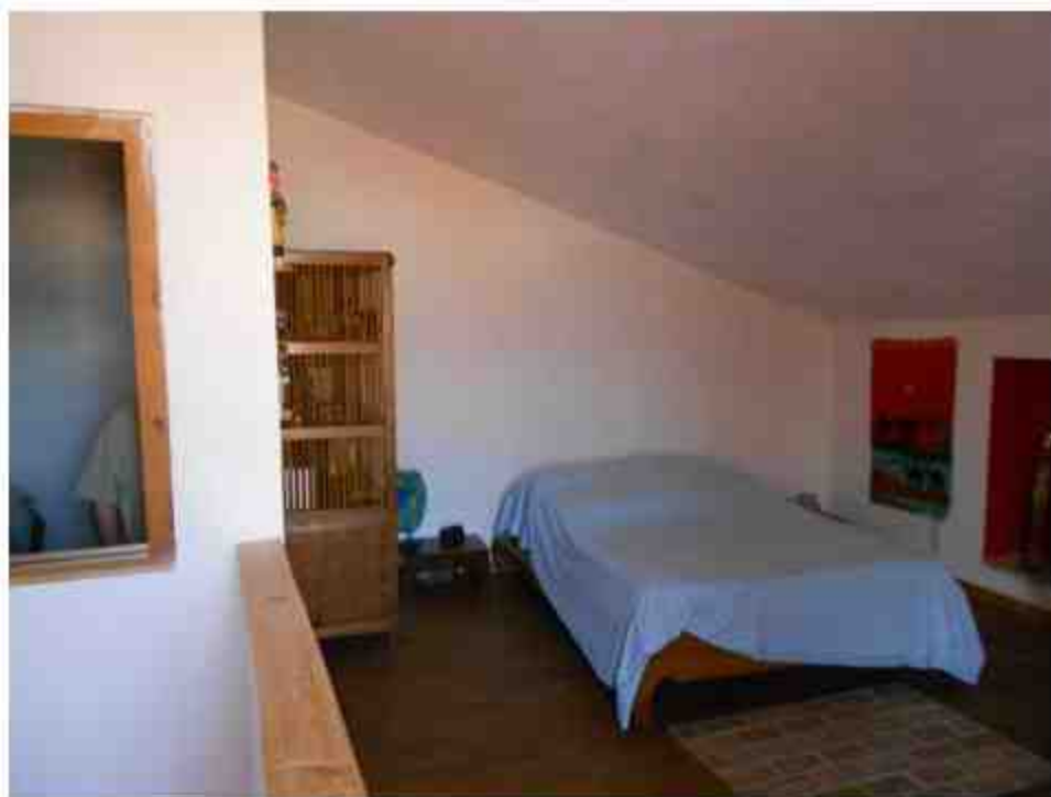
Foto N. 32.- livello sottotetto, camera da letto