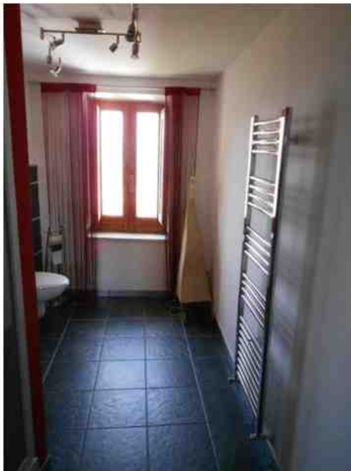
Foto N. 25.- Primo livello- WC