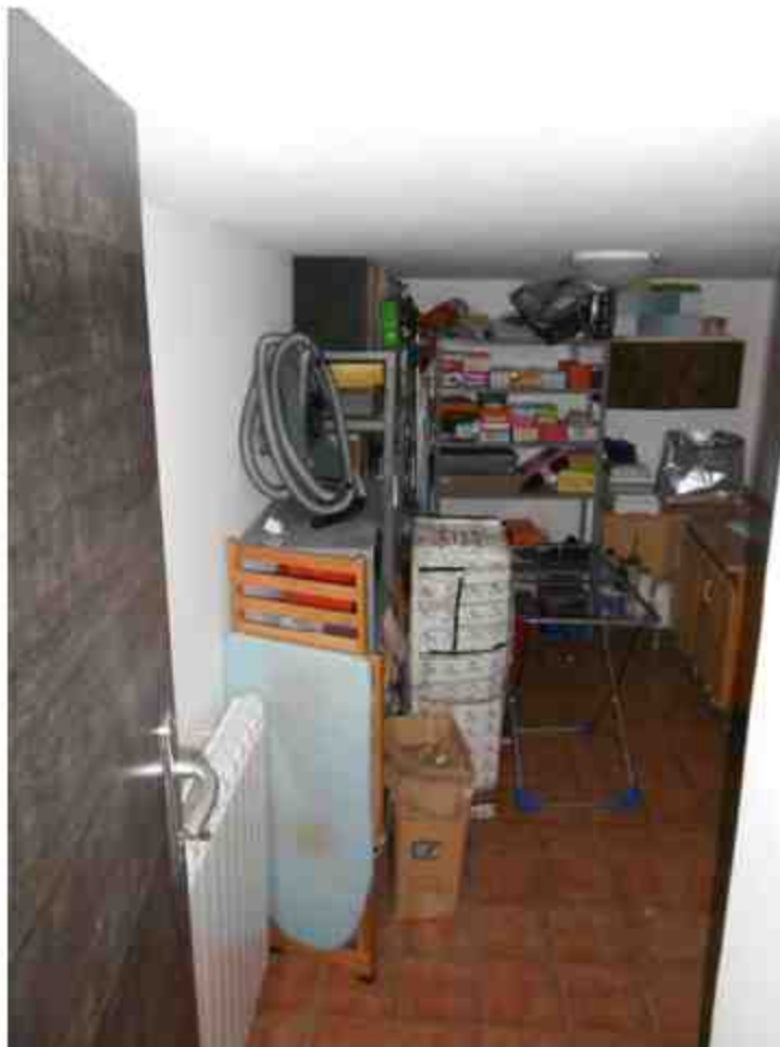
Foto N. 27.- Primo livello- Vano lavanderia adiacente al WC