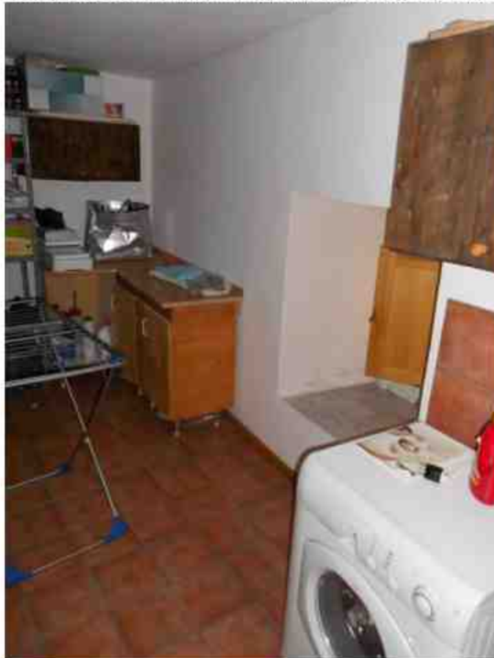
Foto N. 28.- Primo livello- Vano lavanderia adiacente al WC