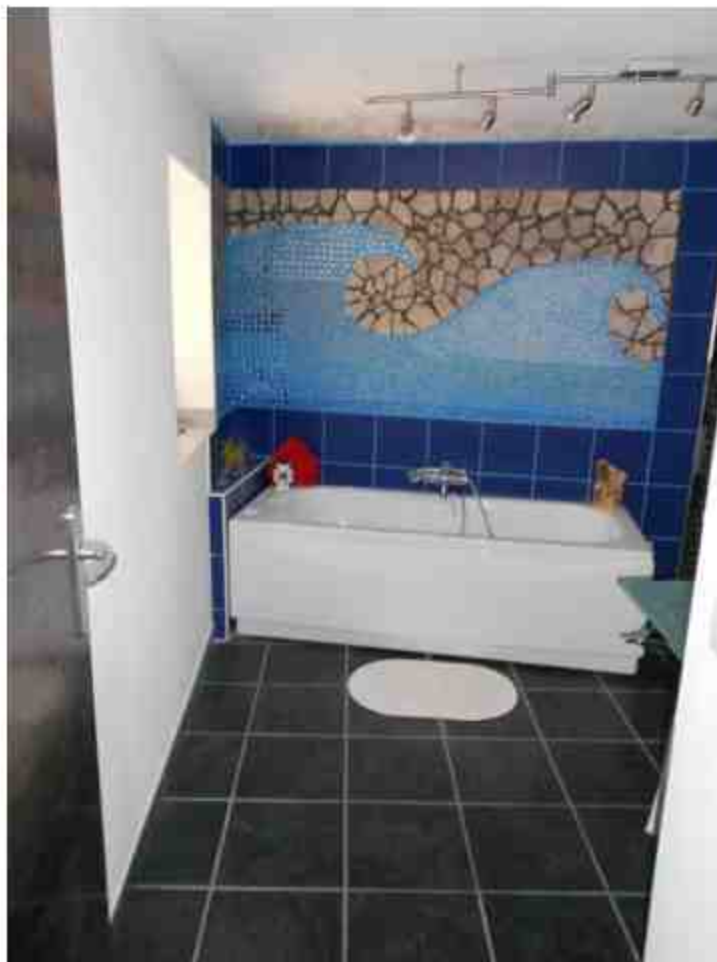
Foto N. 19.- Primo livello- WC