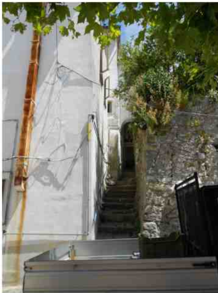
Foto N. 1.- Zona di ubicazione dell'appartamento oggetto di E.I.