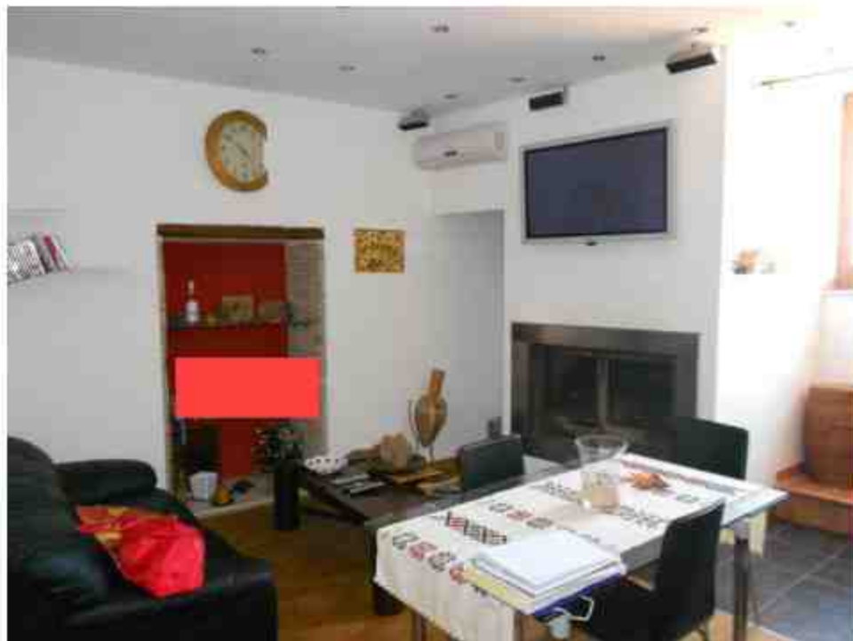
Foto N. 13.- Primo livello- soggiorno cucina