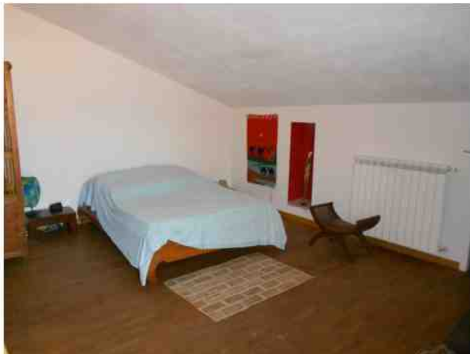
Foto N. 33.- livello sottotetto, camera da letto