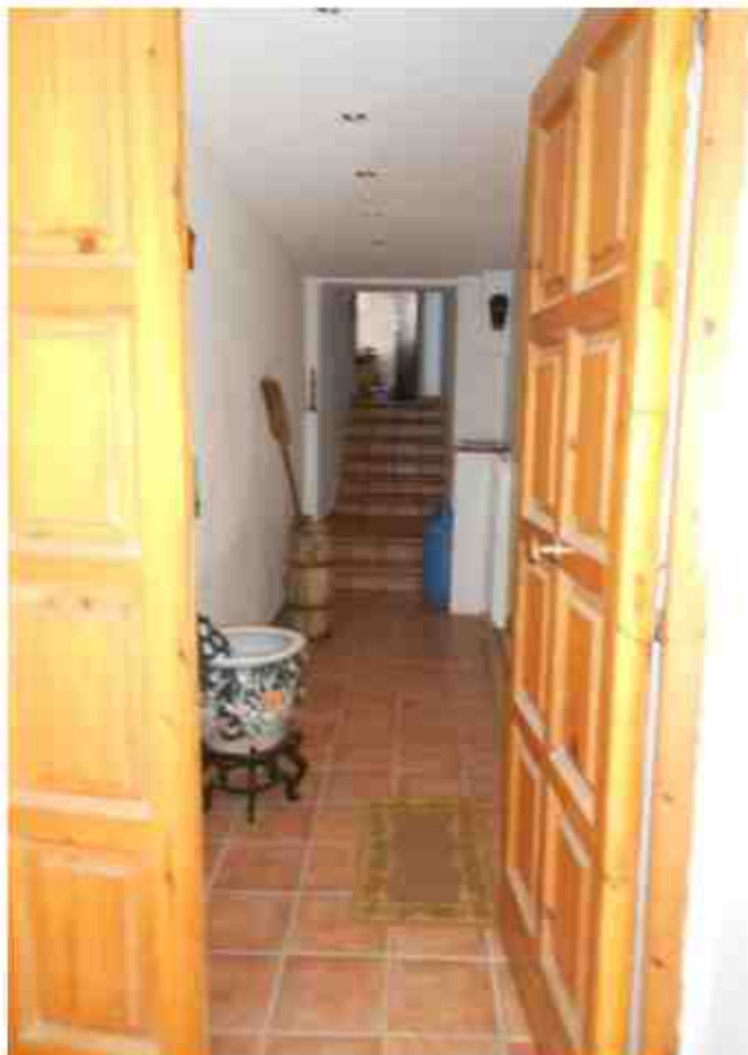
Foto N. 3.- Ingresso appartamento con corridoio e scale per i livelli superiori