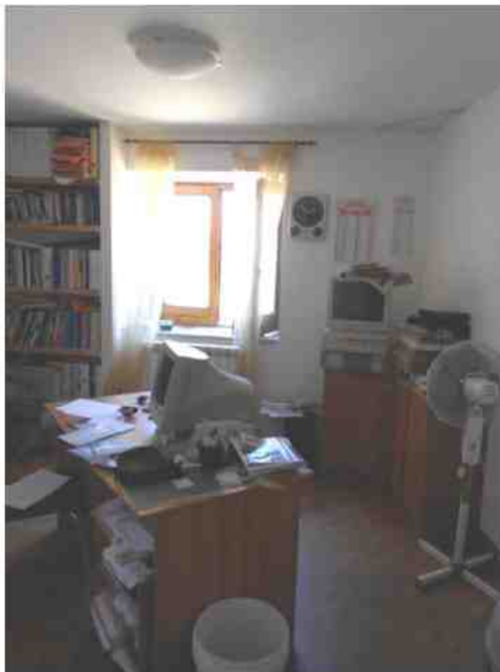
Foto N. 7.- Piano Terra/rialzato - camera 1