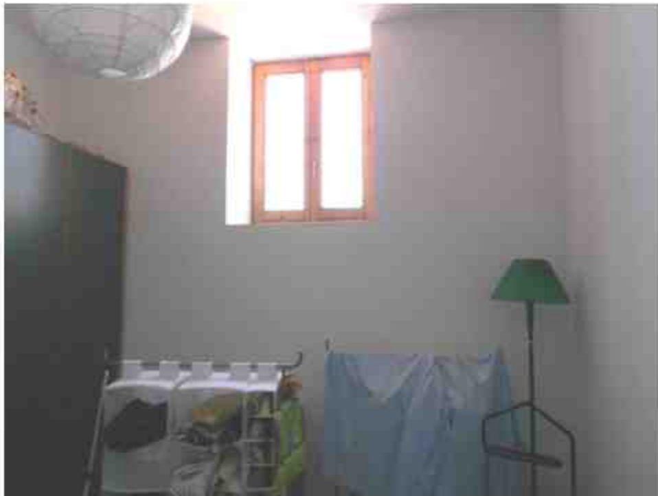
Foto N. 11.- Piano Terra/rialzato- camera 2