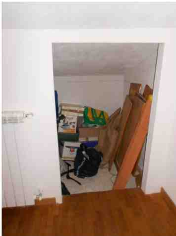
Foto N. 37.- livello sottotetto, ripostiglio