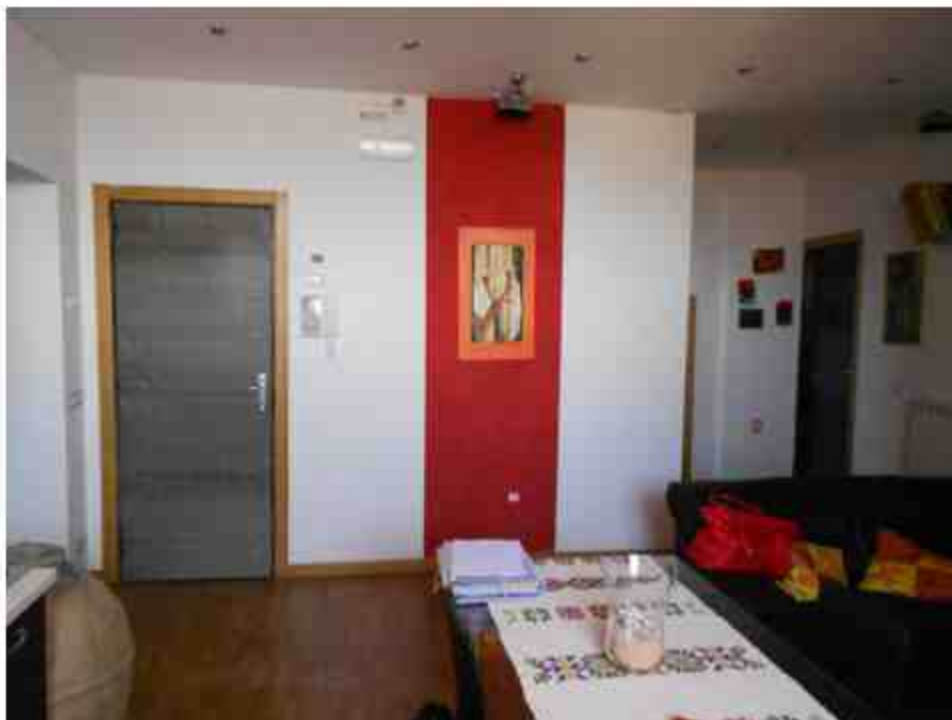
Foto N. 17.- Primo livello- soggiorno cucina. E visibile a destra la porta d'accesso al WC; frontalmente vicino al citofono è visibile una porta che conduce ad un ripostiglio