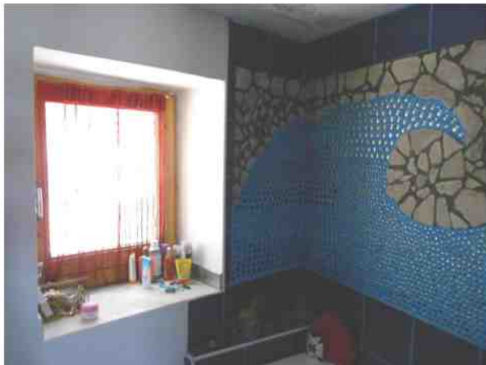
Foto N. 21.- Primo livello- WC