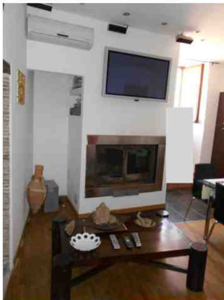
Foto N. 14.- Primo livello- soggiorno cucina