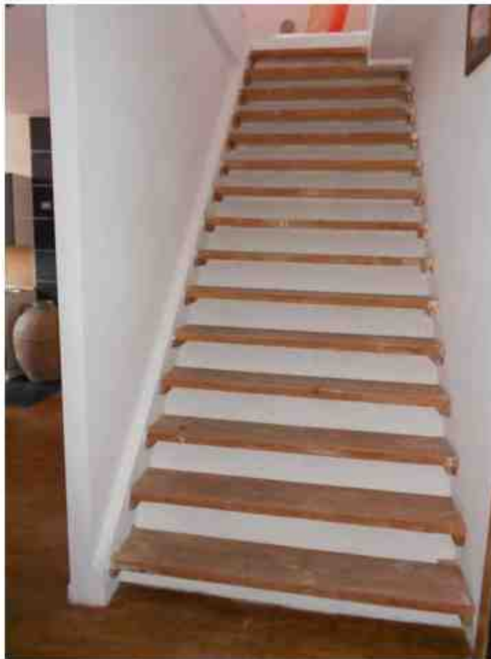
Foto N. 30.- Scale interne d'accesso al livello sottotetto