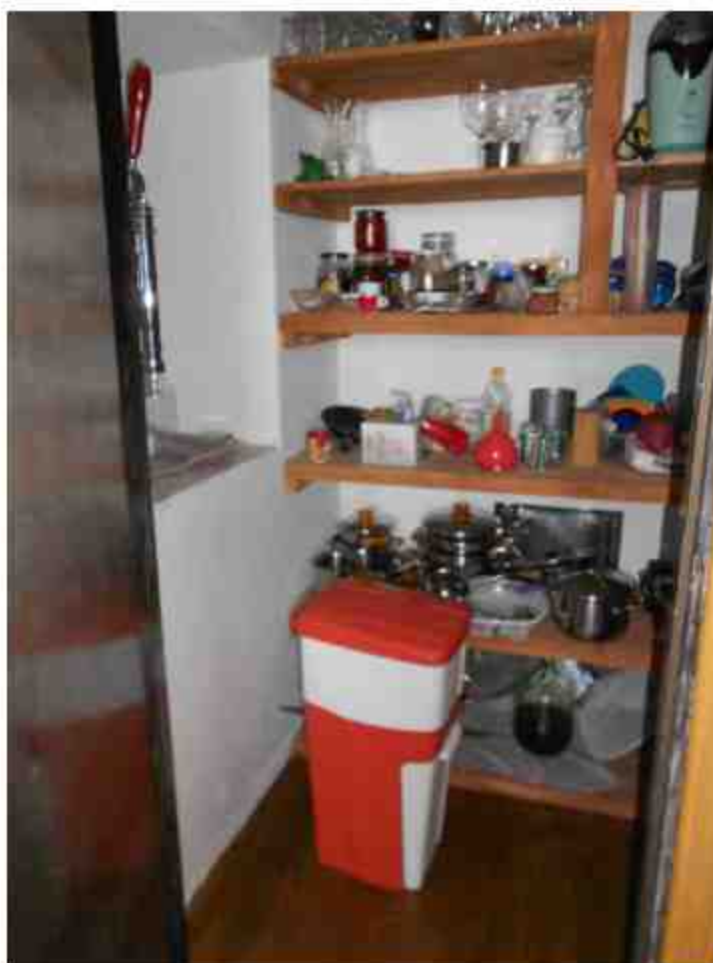
Foto N. 18.- Primo livello- Ripostiglio