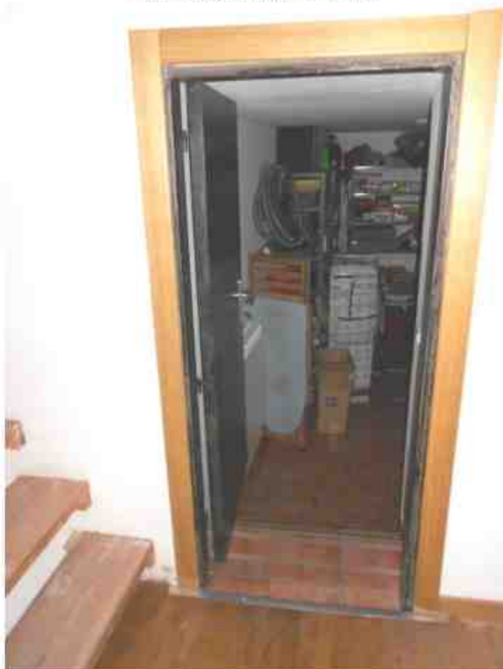
Foto N. 26.- Primo livello- Vano lavanderia adiacente al WC