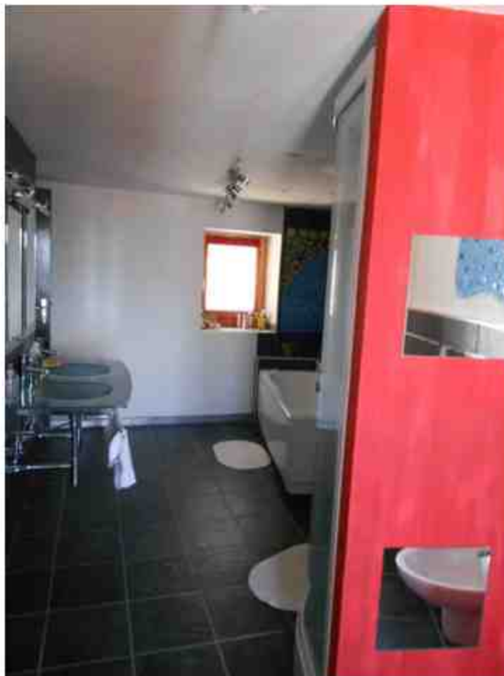
Foto N. 23.- Primo livello- WC