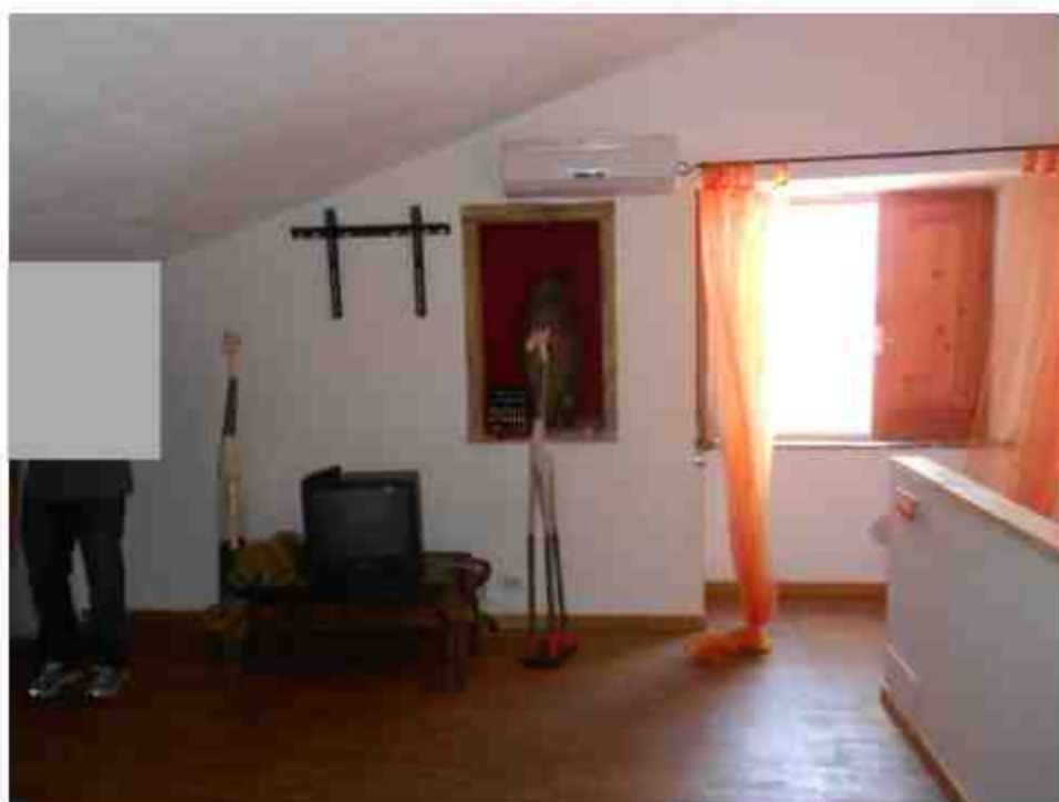
Foto N. 34.- livello sottotetto, camera da letto