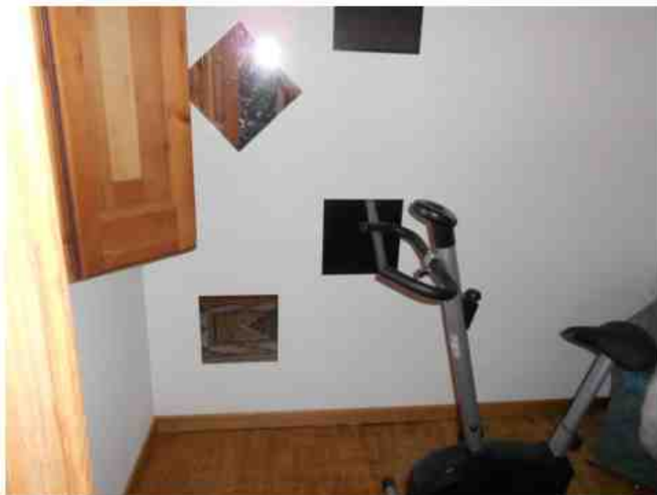
Foto N. 36.- livello sottotetto, vano laterale