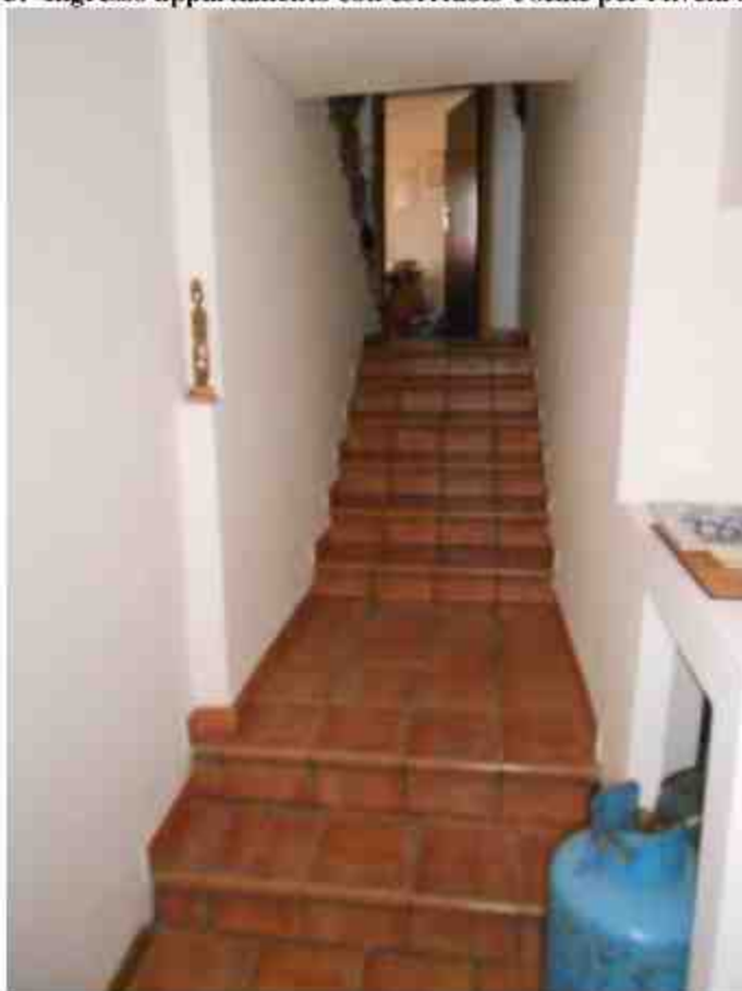
Foto N. 4.- Corridoio di ingresso con scale