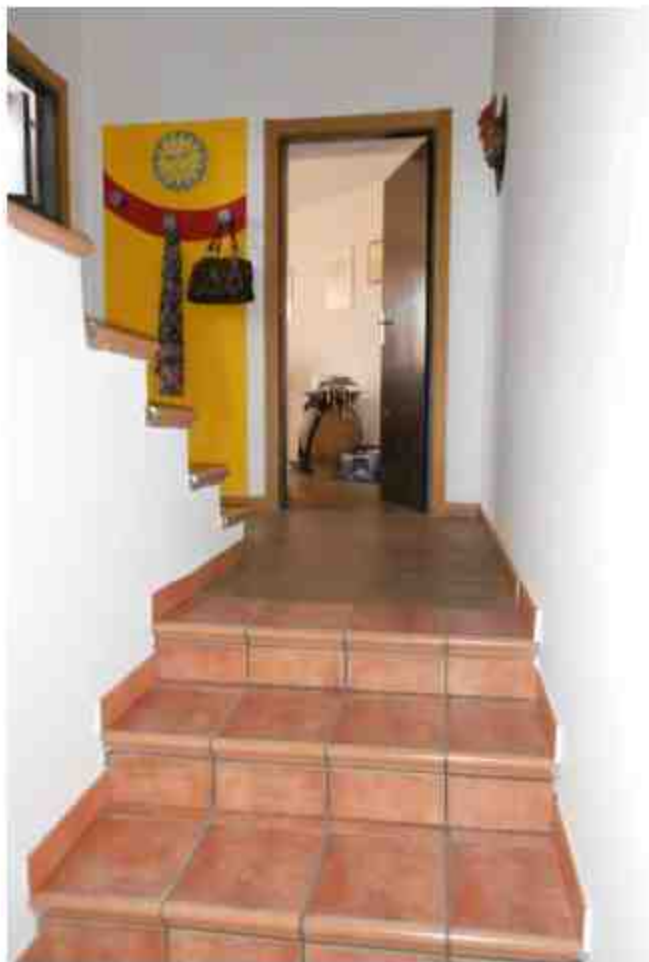
Foto N. 5.- Pianerottolo piano Piano Terra/rialzato