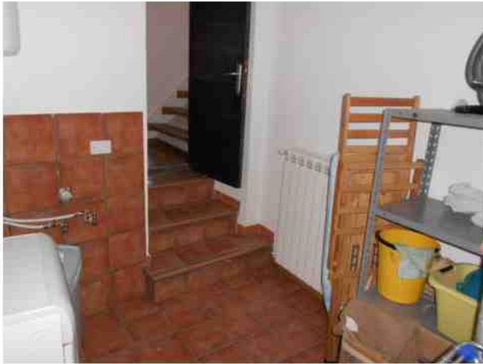
Foto N. 29.- Primo livello- Vano lavanderia adiacente al WC